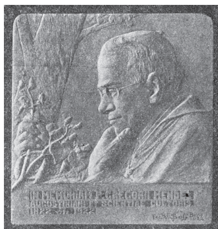
▲ Abb. 1: Die im Jahr 1922 zur Jahrhundertfeier in Brunn enthüllte Gedenkplakette von Gregor J. Mendel.