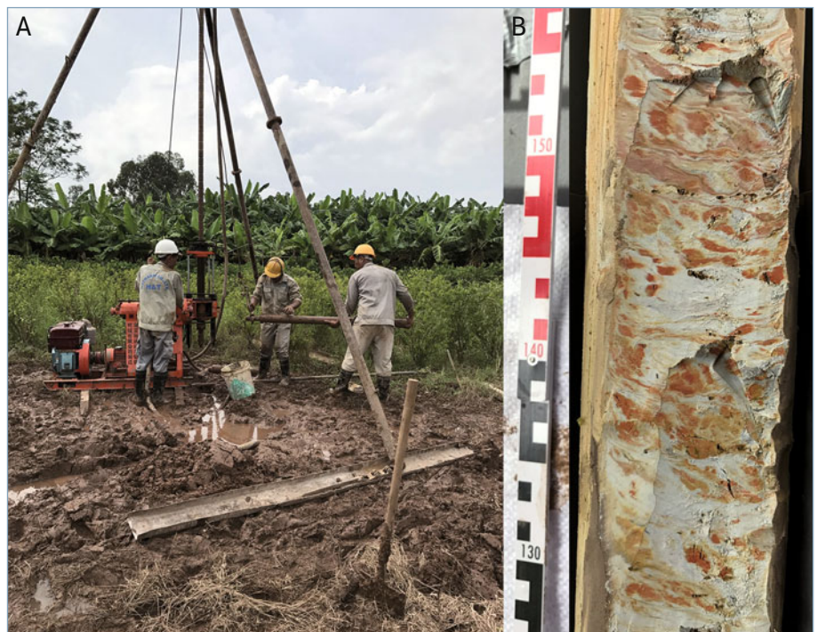
▲ Abb. 1: Arsen im Boden. A, Grundwasserbohrung nahe des Dorfs Van Phuc, südöstlich von Hanoi, Vietnam. B, Bohrkern ( d = 10 \text{ cm} ) wurden aus bis zu 46 m Tiefe entnommen. Rostrote Bereiche, welche den Bohrkern durchziehen, sind charakteristisch für arsenhaltige Eisen(III)-Minerale.

Der Reisertrag wird meist durch Stickstoffdüngung gesteigert, wodurch es zu Denitrifikation und der Freisetzung von Zwischenprodukten wie Nitrit und Lachgas (Distickstoffmonoxid, \text{N}_2\text{O} ), aber auch zur Oxidation von \text{Fe}^{2+} und Bildung von Eisen(III)-Mineralen durch nitratreduzierende eisenoxidierende Bakterien kommt. Durch die abiotische Reduktion von Nitrit durch Eisen(II) (Chemodenitrifikation) kommt es zur Bildung und