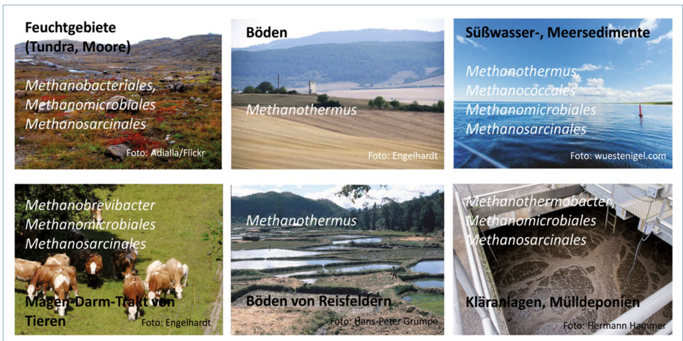
▲ Abb. 1: Typische Lebensräume methanbildender Archaeen.

Jährlich fallen weltweit etwa 10^3 \text{ km}^3 Abwasser an – das rund 20fache Volumen des Bodensees. In industrialisierten Ländern gelangt das Abwasser zum großen Teil wieder gereinigt in den Wasserkreislauf zurück und trägt zum Erhalt einer hohen Wasser- und Trinkwasserqualität bei. Abgesehen von mechanischer Säuberung und chemischer Fällung von Phosphaten klären vor allem Mikroorganismen (Bakterien, Archaeen,